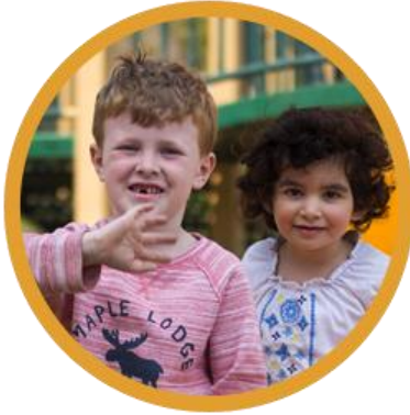
Réussite des jeunes