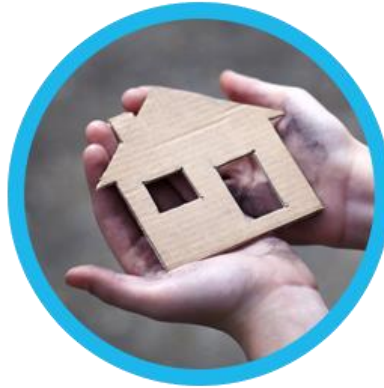
Amélioration des conditions de vie