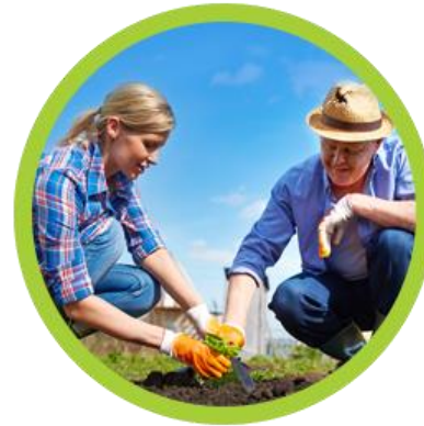
Santé des gens et des communautés